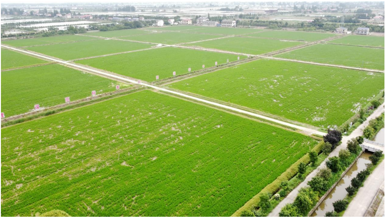
“稻稻虾”种养模式示范基地